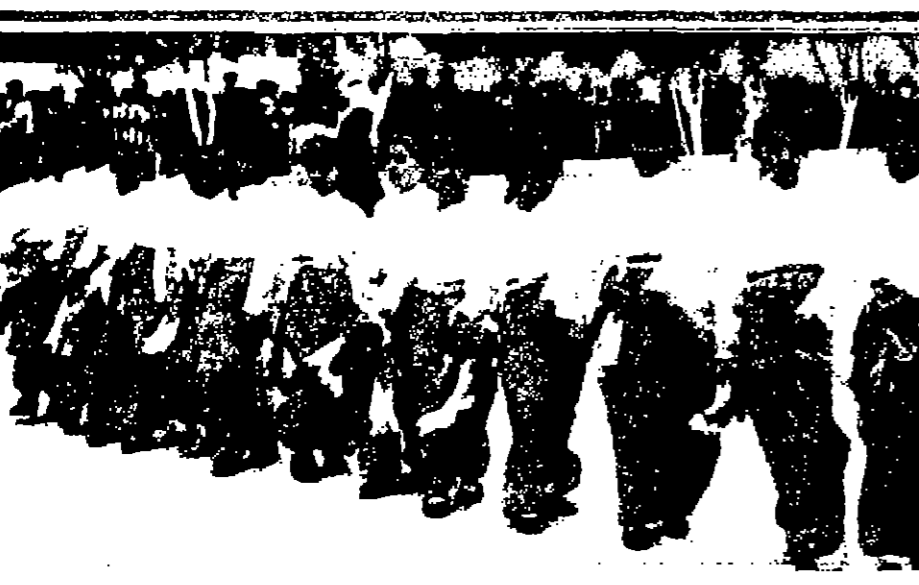
جانب من العرض الفني للمدرسة